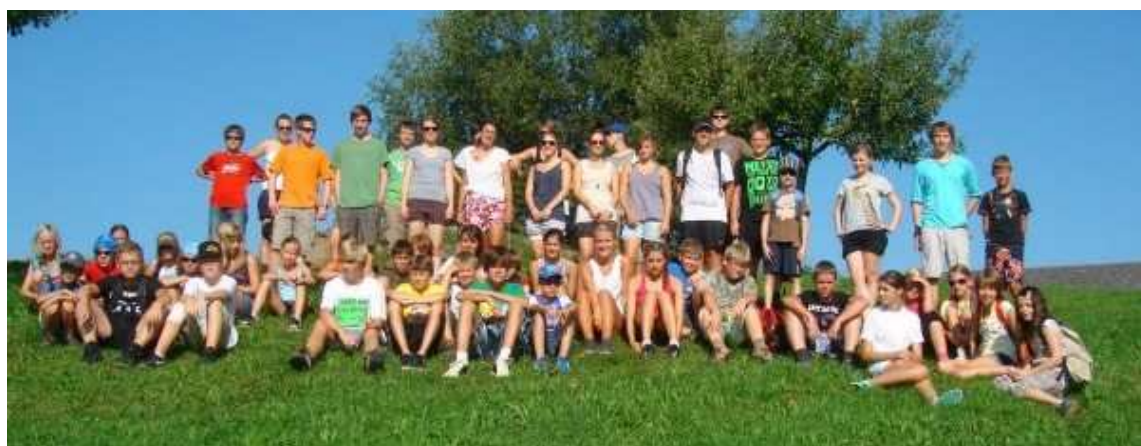
Einige Ministranten bei einer Wanderung während des Minilagers.