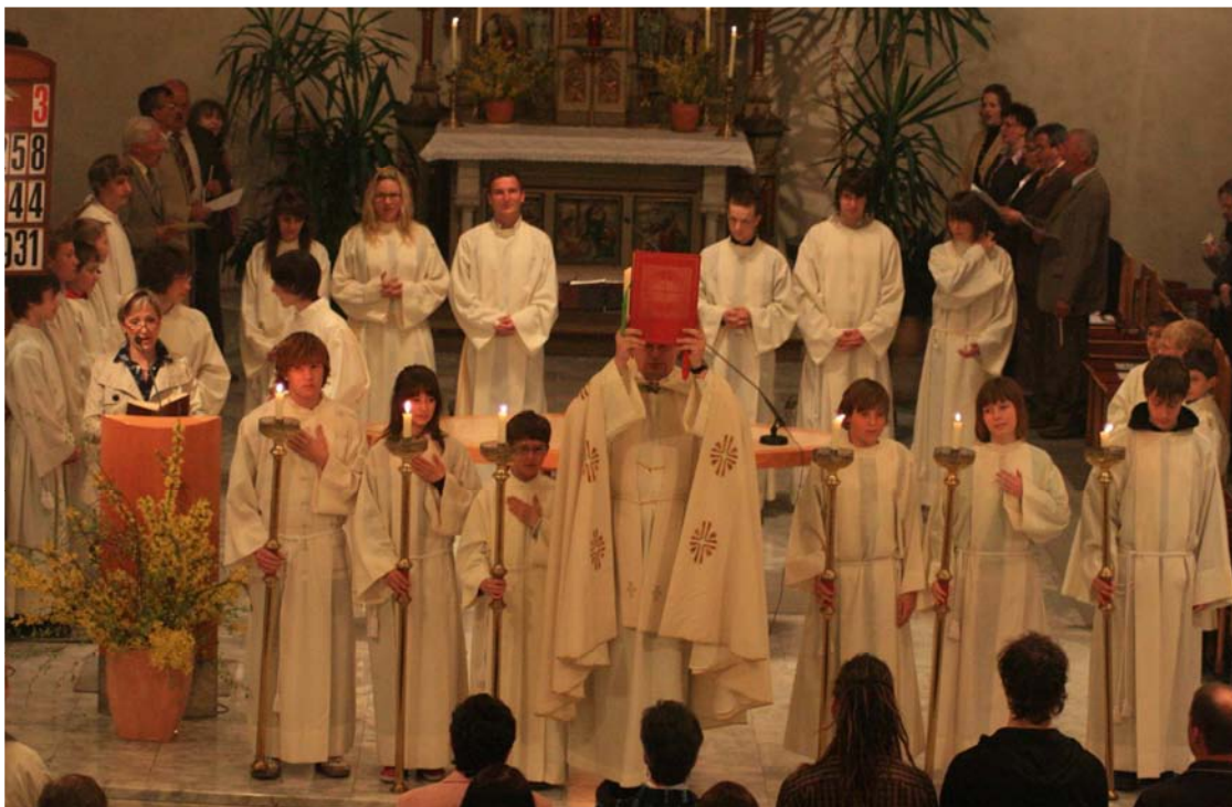
Gerade an den großen Festtagen, aber nicht nur dann, sind viele liturgische Dienste im Einsatz.

Der Arbeitskreis hat ein großes Anliegen an die Bevölkerung: Die 6 Kantoren sind aufgrund ihrer geringen Anzahl relativ oft im Einsatz und wären um sangesfreudige Unterstützung sehr froh. Interessenten mögen sich bitte beim Pfarrer oder bei Peter Moser melden!!