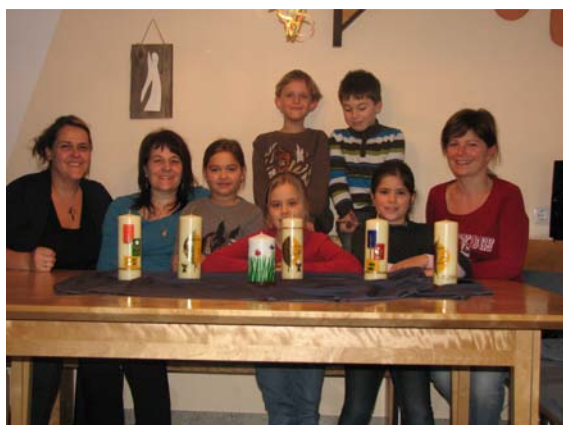
Die Beschlinger Gruppe mit ihren selbstgebastelten Kerzen

Der Mittelpunkt jeder Tischrunde ist die Jesuskerze, welche sowohl die Taufkerze symbolisiert, als auch die Freundschaft mit Jesus und die Gemeinschaft unter den Kindern darstellt.