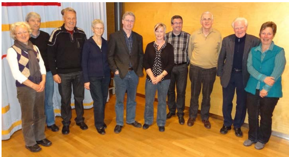
Der Vorstand der Initiative Pfarrheim Nenzing

Hier einige aktuelle Zahlen und durchgeführte Veranstaltungen auf einen Blick: